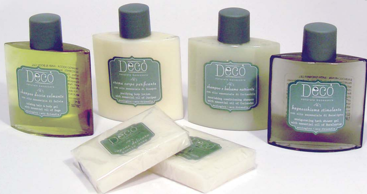
Flaconi | Bottles 50 ml Sapone | Soap 30 g.